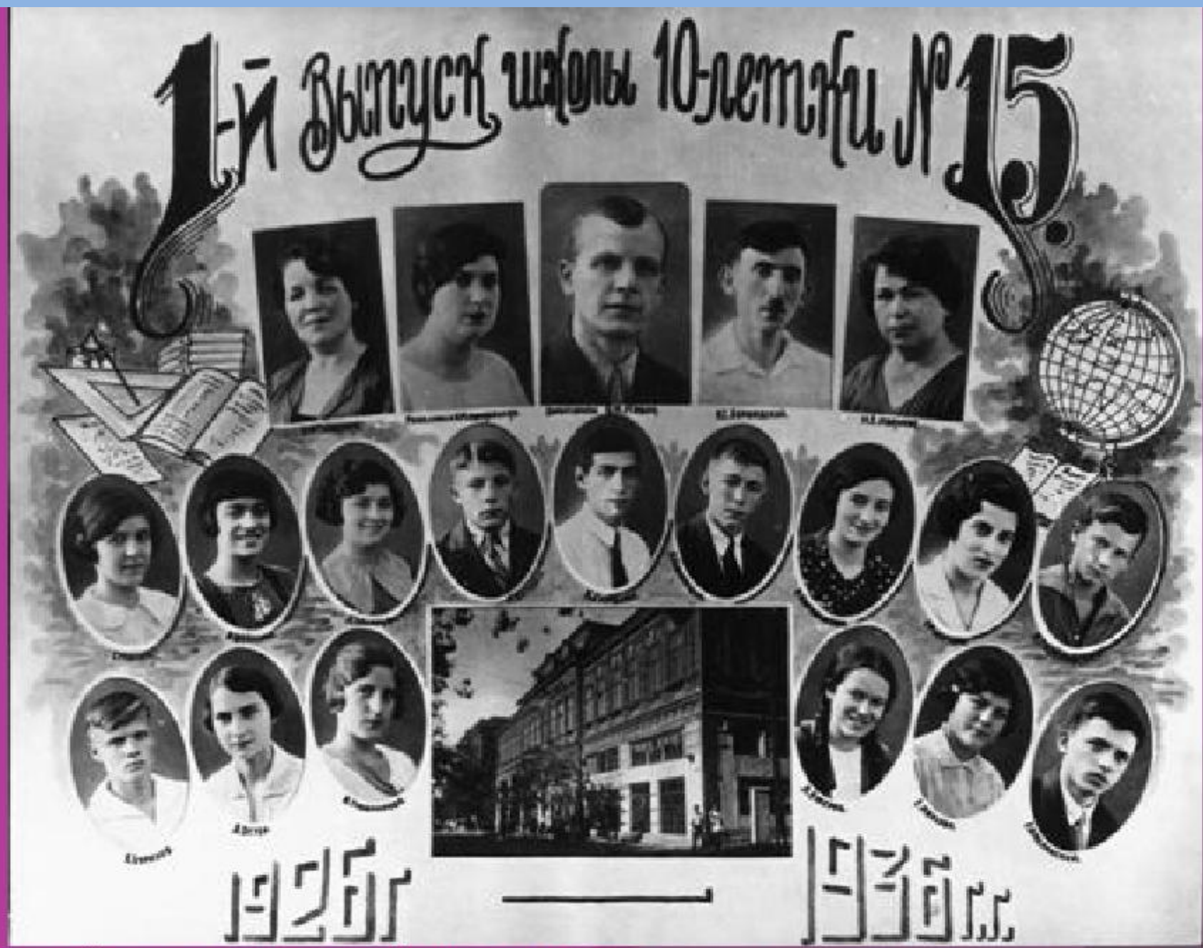
Первый выпуск ростовской школы № 15. Солженицын — во втором ряду четвёртый справа. 1936.