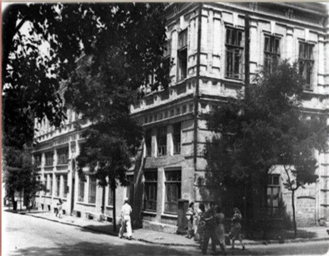
Школа № 15, в которой учился А. И. Солженицын.